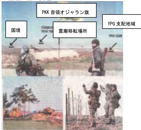
(2月23日付 C 紙 11 面、M 紙インターネット版)

(3)23日、ユルマズ国防大臣は、「スレイマン・シャーの新たな霊廟は、国境から約180mシリア側だが、徒歩圏内であり、トルコ人は参拝しようではないか。国土が失われたとする野党の批判はあたらない。」と発言。(2月24日付 HD 紙 1 面)