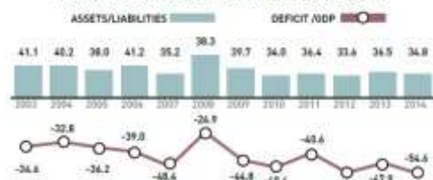
PROPORTION OF LIABILITIES COVERED BY ASSETS AND DEFICIT / GDP: 2003-2014

AKPが政権与党となった2003年当時は、対外債務の対外資産比率は41%で、対外債務の対国民所得比は35%であったが、対外債務の比率は拡大してきてきている。IMFは、対外債務の対国民所得比40%以上をレッドラインとしている。一方、2014年は、対ドル・リラ相場が16%近く下落したことも対外債務増加の要因である(2014年の対外債務は1年間で24%増加)。(2月23日付HD紙10面)